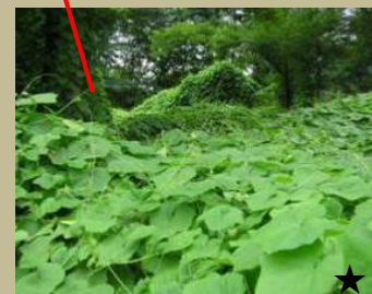
他の植物への被圧

外来生物法により、生きたままの移動が禁止されているため、天日にさらすなどして枯死させてから、通常の可燃ごみと一緒に捨ててください。実は、種がこぼれないよう袋に入れてください。