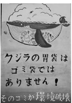
遊佐光希さんの作品