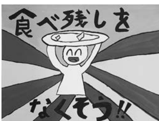
役優衣さんの作品