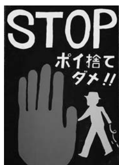
森田ヒカルさんの作品