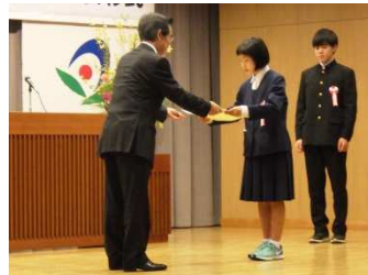
昨年の表彰式の様子

11月3日(土) 午後1時30分～ 五日市地域交流センター3階 まほろばホール ※入賞された方には、表彰式のご案内を10月下旬に送付します。 ※「青少年善行表彰式」とあわせて行います。