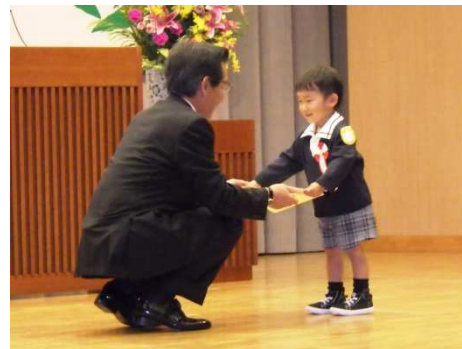
昨年の表彰式の様子