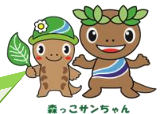
森っこサンちゃん

今年の『 技術職(土木・建築) 』は、 専門試験は行わず 、 大学卒のほか、『 短大卒 』及び『 高校卒 』までの方を対象 としています。(詳しくは4ページをご覧ください。)