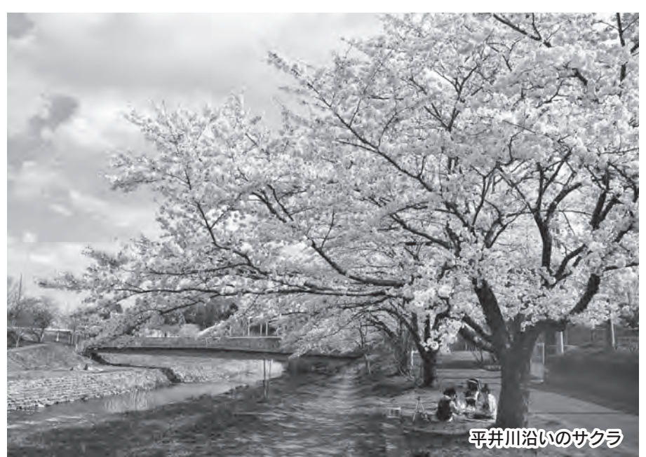
平井川沿いのサクラ