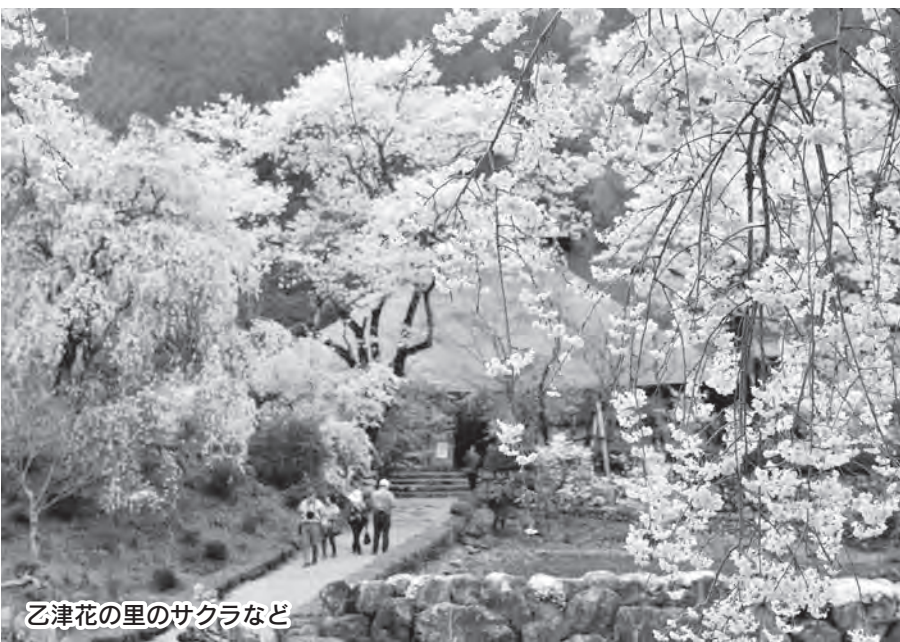
乙津花の里のサクラなど