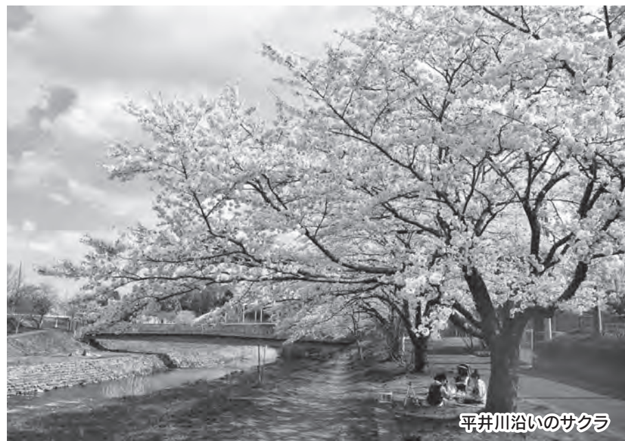
平井川沿いのサクラ