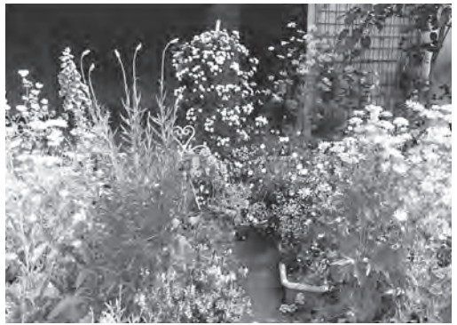
オープンガーデン

▽マップ配布場所 市役所1階 総合案内、地域防災課、五日市出張所、中央公民館 花めぐりウォーキング 参加者募集 オープンガーデンとして登録していただいている庭をバスと徒歩で見学します。 ▽期日・内容 ① 5月8日(月): パンジーなどの庭 ② 5月15日(月): バラなどの庭 ▽時間 午前9時集合、午後3時解散(予定) ▽集合・解散場所 市役所 ▽対象 市内在住・在勤の方 ▽定員 各35人(抽選) ▽持ち物など 弁当、飲み物、雨具、歩きやすい服装・靴 ▽費用 無料 ▽申込み方法 4月14日(金)迄(有効)までに、往復はがき(1枚で3人まで)に「花めぐりウォーキング希望」、申込者全員の郵便番号、住所、氏名、電話番号(携帯)、希望のコースを記入の上、郵送してください(返信用表面にも返信先を記入)。 ※申込みは、1人1コース ▽申込み・問合せ 地域防災課 地域振興係(直通558・1394)