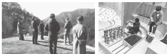
東京チェンソーズさん、森のおもちゃ美術館の見学の様子

藤岡市の協力隊員も大変喜んでいました！ご対応いただきました皆様、本当にありがとうございました。