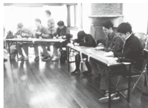
皆で竹で「まきす」を作りました。

豊かな自然に囲まれる檜原村の暮らしは、持続可能なものであると感じています。今後は「ひのほらサステナブル」として、これまでお世話になってきた方々と繋がりつつ、竹の利活用など自然環境を活かした体験の機会をつくり、観光の分野とも繋がりながら、引き続き檜原村で活動していく予定です。今後ともよろしくお願ひします。