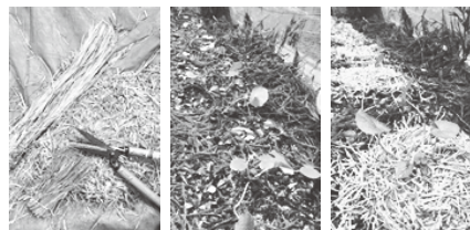
刻んだ稲わらを敷く Before After

真冬を迎えたわさびの様子が見えなくてならないので、稲わらを敷き、シートで囲いました。檜原の沢筋など、自生しているわさびを見たことがあるので、檜原の冬を越せると見込んでいます。ただ、山は沢と違い、気温より温かい流水もなく、風にさらされ続けるので、わさびが凍ってしまわないか心配です。全体的に氷点下になるようになってから、霜に当たって枯れる葉が増えてきました。あと少しの辛抱。春が待ち遠しいです。