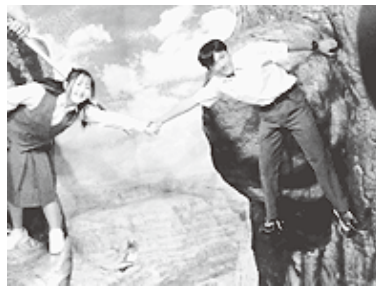
トリックアート美術館にて