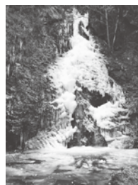
去年の最大結氷日の様子

あけましておめでとうございます！今年も1月5日から2月20日まで、払沢の滝冬まつり実行委員の一員として、毎朝交代で払沢の滝の結氷率を確認してきます。当番が回ってくるのは2週間に1回程度ですが、朝の静けさと、冬のキリリとして澄んだ空気のなか、遊歩道を歩いて滝を見に行くのは本当に気持ちがいいです。今年は暖冬が予想されており、滝がどれだけ凍るか気になるのですが、凍らなくてもぜひ、皆さんも払沢の滝に足を運んでみてください！朝の払沢の滝散歩、おすすめです。