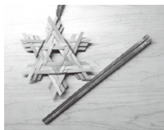
竹で作った箸と飾りです。

あけましておめでとうございます。先月の「ゼロ・ウェイスト PLUS ～持続可能な暮らし～上映会」の際に、入口のくるくるフリーマーケットに竹で作った飾りや箸を置かせていただきました。自身の竹細工練習に加え、皆さんに活動を知っていただく機会にもなりましたら幸いです。今後竹を使ったワークショップ等も開催予定です。