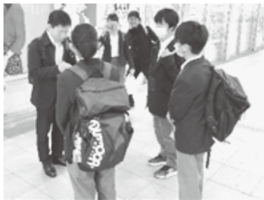
本川越駅でのチェック

10月20日（金）に1年生が修学旅行で川越へ行きました。昨年度までは感染症対策で、学校から川越市内までバスで移動していましたが、今回は公共交通機関を利用して移動しました。電車の乗り換えで反対方面の電車に乗りそうになったり、途中で道に迷ったり、予定どおりにいかない部分もありましたが、班のみんなで力を合わせて行動しました。スローガンにあるように、檜原と川越の違いを事前学習で調べましたが、実際に現地に行って目で見て肌で感じながら、さらに学びを深めることができました。