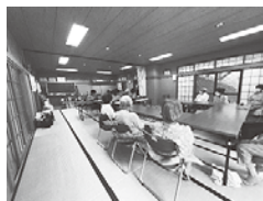
お邪魔させていただいている数馬のいきいきサロンの様子

以前いただいたお酒が美味しかったので、今年は自分で買って、去年のスポーツの録画を見ながら飲んでいきます！