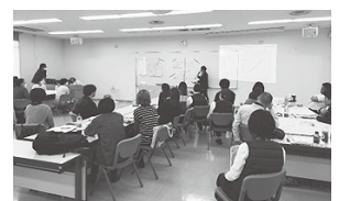
グループで議論した内容を発表している様子