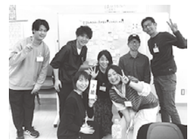
同じグループだったメンバーとの集合写真！

先日、2泊3日で全国の地域おこし協力隊が集まる研修に参加してきました。参加したのは、北は北海道から南は沖縄までの103地域から来た、146名！研修では、地域活性化をテーマに研究・実践を行う学者の方々や、地域おこし協力隊OB・OGの方々の講義を聞いたり、「こういう問題が起きたらどうする？」「こういう地域に協力隊として赴任することになったら、まずはどんなアクションを取る？」といった課題に対して、チームに分かれて議論したりと、研修という機会ではなければ得られない体験や、知識を多く得ることができました。また、どの地域からきた協力隊もやる気とエネルギーに満ち溢れていて、たくさん刺激をもらいました。研修で学んだことを活かしながら、引き続き日々の活動に取り組んでいきたいと思っています！