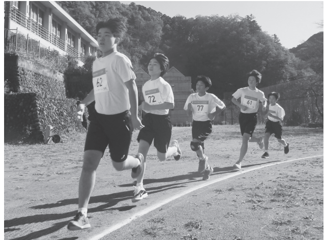
《マラソン大会 11月30日(土)》

羽村市のゆとろぎホールにおいて、生徒全員で混声合唱とミュージックベルを演奏披露しました。