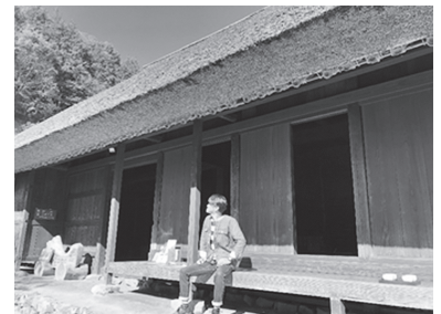
秋の小林家住宅の縁側にて

今年は、私の目標であります【檜原村にキャンプ場を作る】に一步踏み込んで参りたいと思います。檜原村の木を活かしたキャンプ場で、また木工をみんなで楽しむシェア工房も作りたいです。「檜原村が第二の居場所」となって足繁く通ってもらえるキャンプ場を目指して頑張って参りますので、どうぞよろしくお願いいたします。