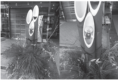
昨年、役場前の門松とひのじゃがくん

新年明けましておめでとうございます。皆さんいかがお過ごしでしょうか。昨年の私は年明けに九頭龍神社へ初詣に行きました。その時は、観光としての檜原村しか知らず、自分が今檜原村に住んでいるとは想像もしていませんでした。