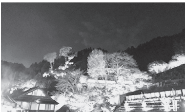
昨年の思い出。紅葉のライトアップが美しい人里もみじまつり

新年あけましておめでとうございます。記念すべきはじめての檜原村での年越しでした。旧年中は沢山の方に大変お世話になりました。有難うございました。皆様にあたたかく迎えていただいてから5ヶ月が経とうとしています。檜原村に引っ越してくるまでは、夏は自然を求めてキャンプに行き、秋は紅葉狩りやお祭りにと出掛けていましたが、去年はどこに行かなくても檜原村ですべて楽しむことができました！檜原村民として、地域の方や村外から遊びに来た方をお迎えする側になり、今までとはまた違う楽しさがありました。