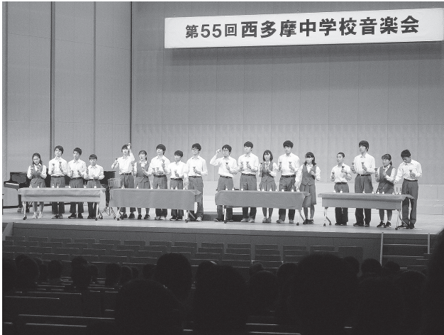
《西多摩連合音楽会 11月7日(木)》

昨年は、地域・関係機関の皆様には大変お世話になり、ありがとうございました。 本年も変わらぬご支援・ご協力の程、よろしくお願い申し上げます。